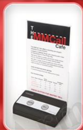
دکمه های روی میز مدل B