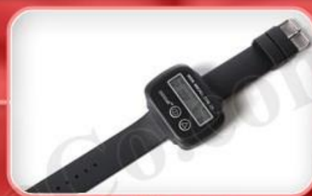
ساعت مچی گارسون