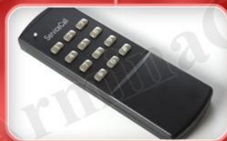
کنترل از راه دور