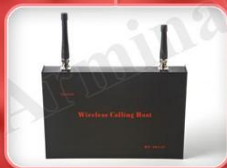
کنترل مرکزی سیستم