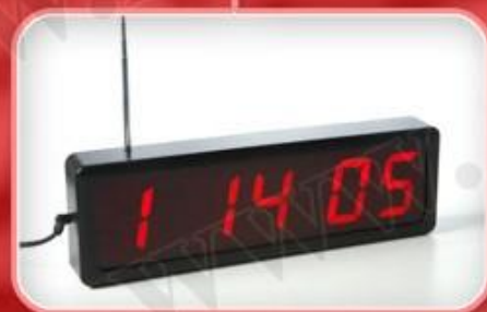
نمایشگر مدل E