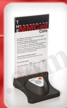
دکمه های روی میز مدل E