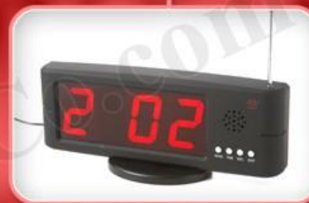
نمایشگر مدل F